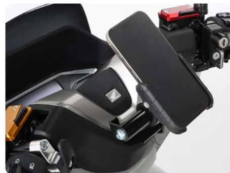
スマホホルダー装着イメージ

掲載内容は2025年2月現在のものです。最新のデータに関してはキットコHPをご覧ください。商品は予告なく変更する場合があります。予めご了承下さい。