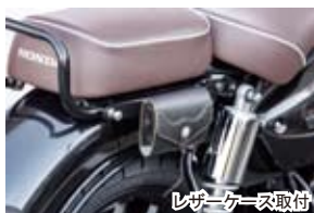
レザークース取付