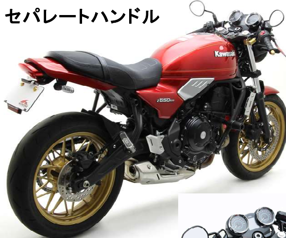
セパレートハンドル

ハリケーン セパレートハンドルは HS4114G-01/B-01 ¥14,300【¥13,000】が適合