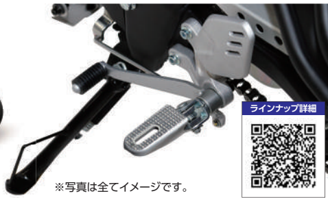
※写真は全てイメージです。