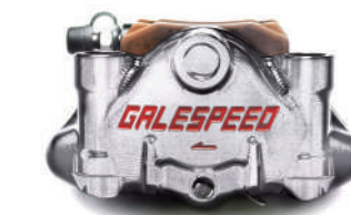
リアラジアルキャリパー60mmピッチ