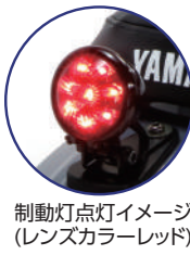
制動灯点灯イメージ (レンズカラー=レッド)