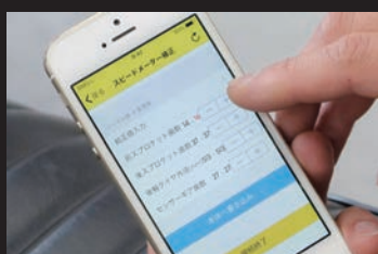
簡単な設定入力(スマートフォン)