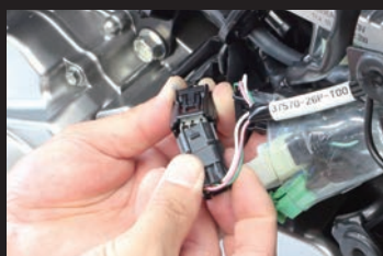
カプラーオンの簡単装着