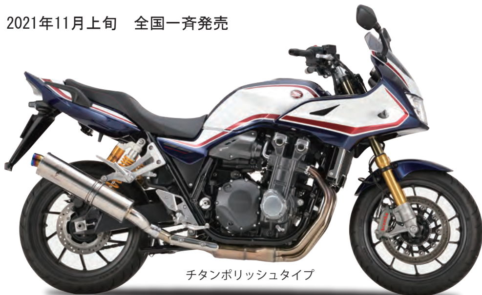
チタンポリッシュタイプ