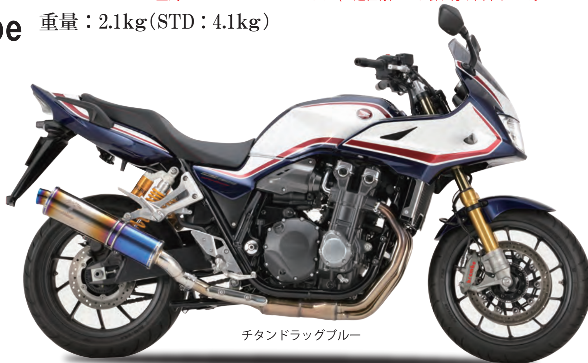
チタンドラッグブルー