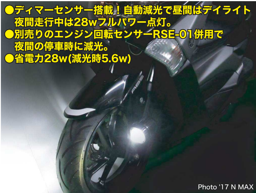
Photo '17 N MAX