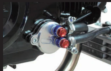
装着写真(オイル取り出し口)