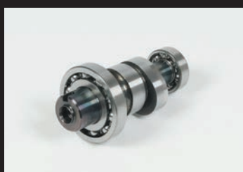
スポーツカムシャフト(N-15カム)