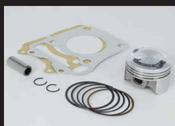
ハイコンピストンキット