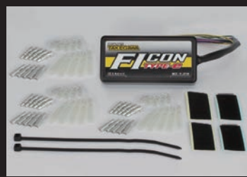
FIコン TYPE-e(インジェクションコントローラー)