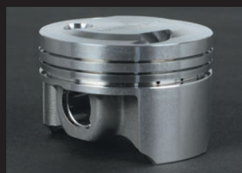
高圧縮比化に耐えるように高剛性アルミ鍛造材を採用。