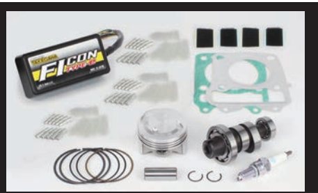
ハイパーチューニングセット