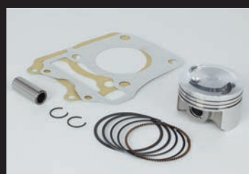
ハイコンピストンキット

■ハイパーチューニングセットは、ハイコンピストンキットにスポーツカムシャフト(N-15)、FIコンTYPE-e(インジェクションコントローラー)、スパークプラグが付属。