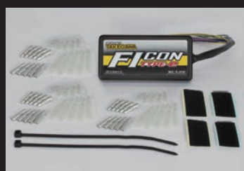
FIコン TYPE-e(インジェクションコントローラー)