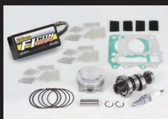
ハイパーチューニングキット