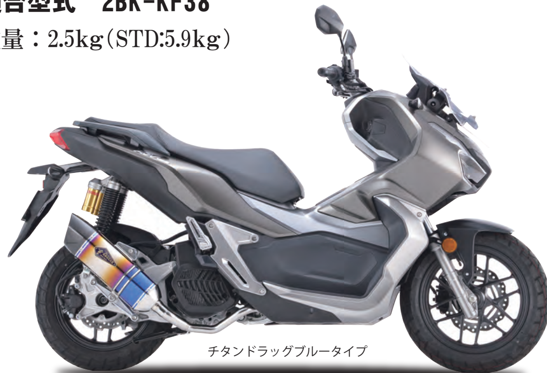
チタンドラッグブルータイプ