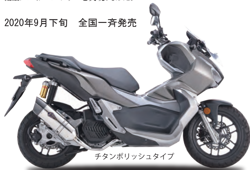
チタンポリッシュタイプ