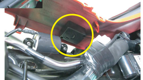
サイレン取付位置