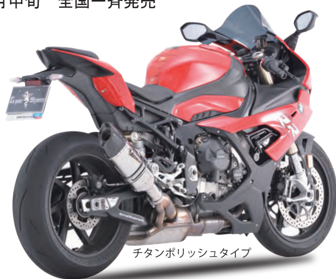
チタンポリッシュタイプ