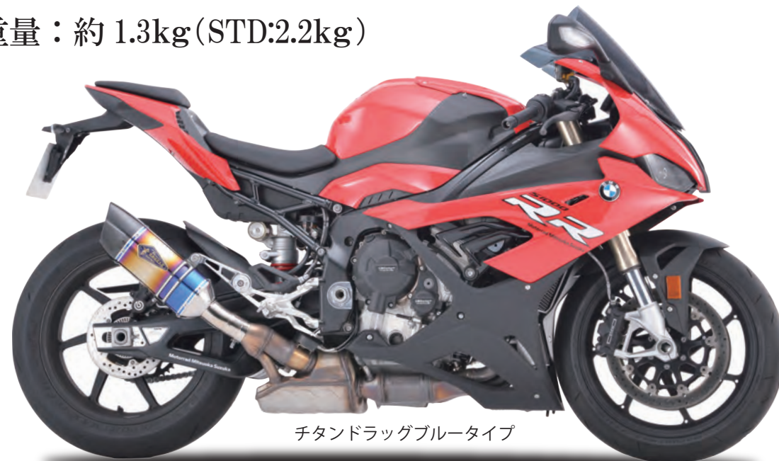
チタンドラッグブルータイプ