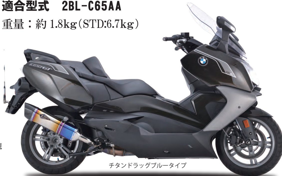
チタンドラッグブルータイプ