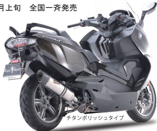
チタンポリッシュタイプ