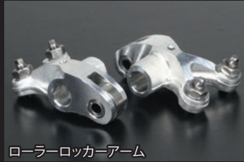
ローラーロッカーアーム

※排気量が125cc以上になる為、原付二種登録では一般公道を走行することは出来ません。競技専用になります。 ※ポアアップキットを装着する際、クラッチの滑りを防止する弊社製スペシャルクラッチキット、各種マフラーの同時装着をお薦めします。 ※FIコン TYPE-Xの装着に関しては、お客様のPC、又はスマートフォンの使用環境、インターネットの接続、注意事項があります。別紙をご覧ください。