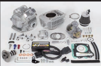
スーパーヘッド4V+R コンボキット181cc (ビッグスロットルボディ付属) (01-05-0608)