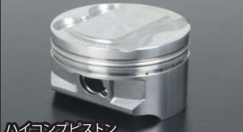
ハイコンピピストン