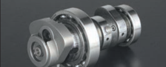
オートデコンプレッションカムシャフト