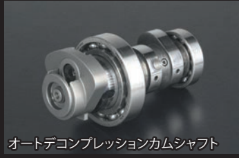
オートデコンプレッションカムシャフト