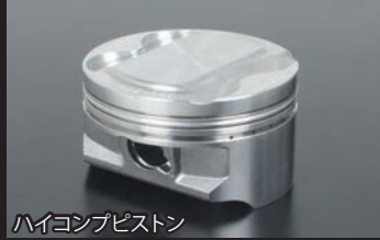
ハイコンピストン