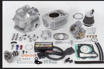
スーパーヘッド4V+R コンボキット181cc (ビッグスロットルボディ付) (01-05-0608)