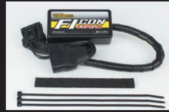
FIコン TYPE-X(インジェクションコントローラー) (05-04-0118)