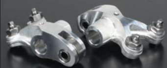
ローラーロッカーアーム