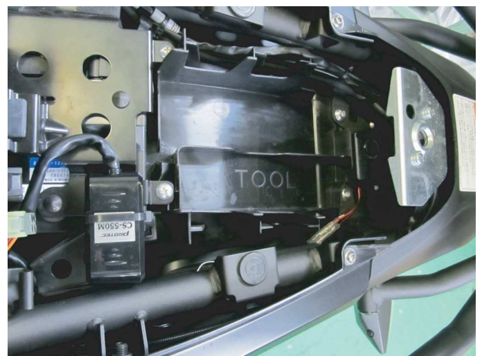
センサー類はシート下に取り付けます。