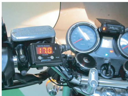
表示部本体はハンドルバーステーで取付け。