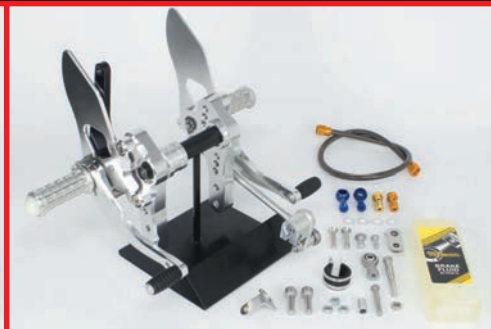
バックステップキット(4ポジション) SP武川製リアキャリアパーブラケット(brembo社製2Pキャリアパー用) 装着車用リアブレーキホースキット プレゼント!! キャンペーン品番:14-06-0002