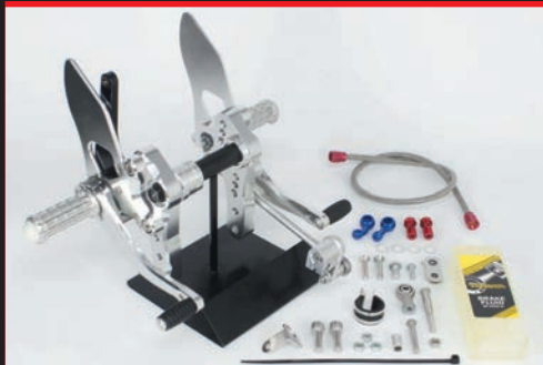
バックステップキット(4ポジション) ノーマルリアキャリアパー用 リアブレーキホースキット プレゼント!! キャンペーン品番:14-06-0001