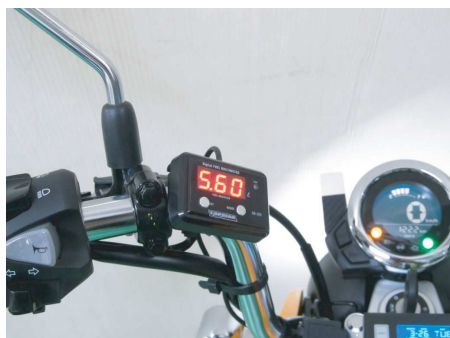
表示部本体はハンドルバーステーで取付け。