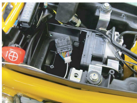
配線の接続先は、ECUカブラーハーネスとテールランプハーネス