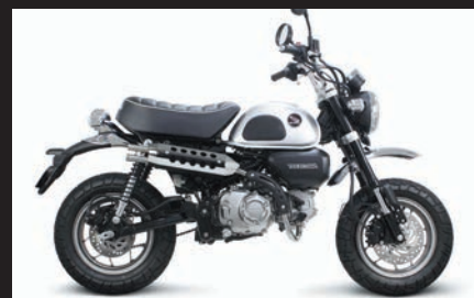
装着写真(メッキプロテクター)