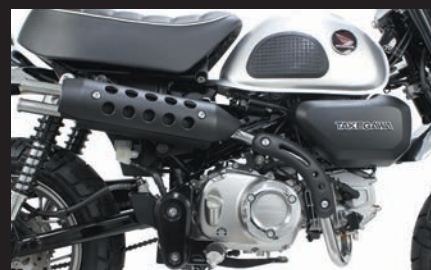
装着写真(ブラックプロテクター)