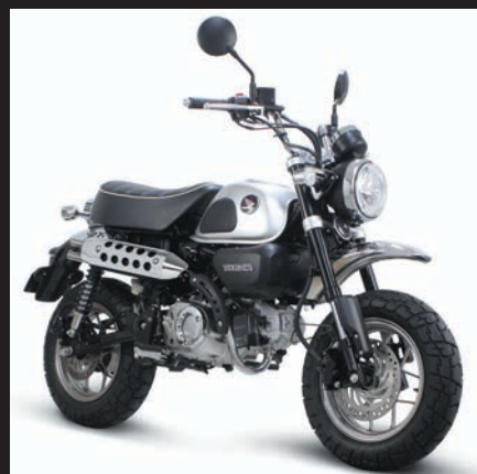
装着写真(メッキプロテクター)