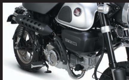
装着写真(ブラックプロテクター)