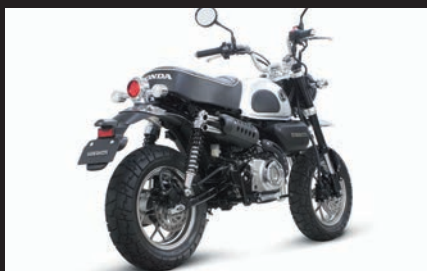
装着写真(ブラックプロテクター)