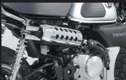
装着写真(メッキプロテクター)