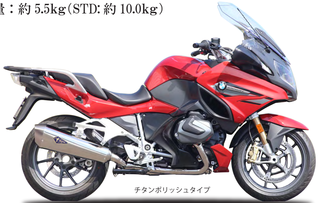
チタンポリッシュタイプ