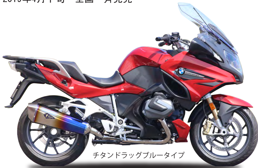
チタンドラグブルータイプ

タイプ アールズギア リアルスペック チタンポリッシュ アールズギア リアルスペック チタンドラグブルー