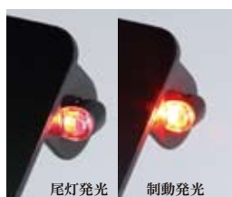
尾灯発光 制動発光

品番 219-5179 定価 ¥12,000 (税抜) (Eマーク:50R-000334 取得) JAN 4934154461799 D