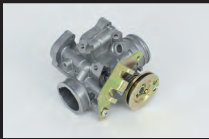
ビッグスロットルボディキット