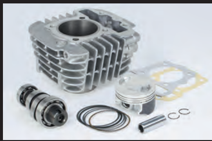
Sステージボアアップキット125cc(ハイコンピストン)

ノーマルシリンダーヘッドの性能を最大限に引出し、高出力化を実現します。高回転域までストレス無く回るエンジン特性をお楽しみ頂けます。 ※スーパーカブ110(JA10-1000001~)・クロスカブ(JA10-4000001~)のボアアップ車両は対応するFIコンがありませんのでご使用出来ません。