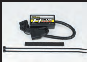
FIコン TYPE-e(インジェクションコントローラー)