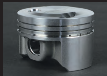
高圧縮比化に耐えるように高剛性アルミ鍛造材を採用。