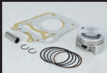
ハイコンピストンキット

■ハイパーチューニングセットは、ハイコンピストンキットにスポーツカムシャフト(N-15)、FIコンTYPE-e(インジェクションコントローラー)、スパークプラグが付属。