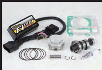
ハイパーチューニングキット