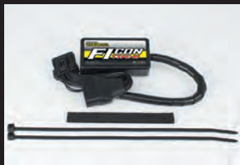
FIコン TYPE-e(インジェクションコントローラー)