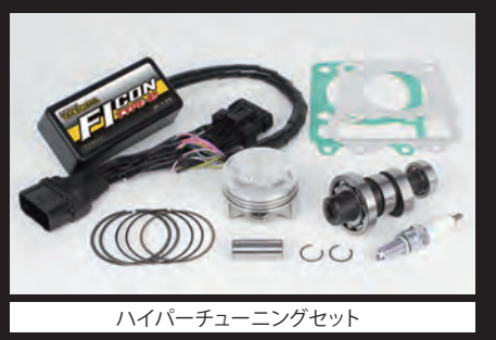
ハイパーチューニングセット