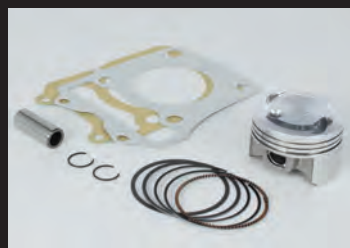
ハイコンピストンキット