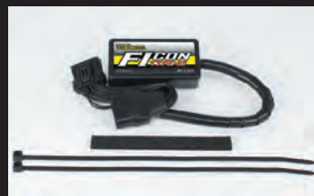
FIcon TYPE-e(インジェクションコントローラー)