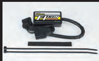
FIコン TYPE-e(インジェクションコントローラー)