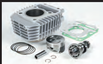
eステージボアアップキット143cc