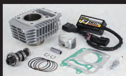
ハイパーeステージボアアップキット143cc