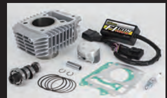
ハイパーeステージボアアップキット143cc