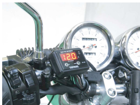
表示部本体はハンドルバーステーで取付け。