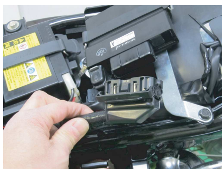
配線の接続先は、ECUカブラーハーネスとボディーアース