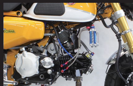
装着写真(スリムラインホース/4フィン5オイルライン)