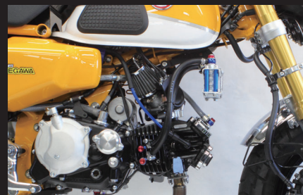
装着写真(ラバーホース/3フィン4オイルライン)