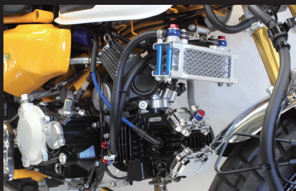
装着写真(ラバーホース/3フィン4オイルライン)