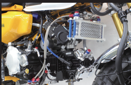
装着写真(スリムラインホース/4フィン5オイルライン)