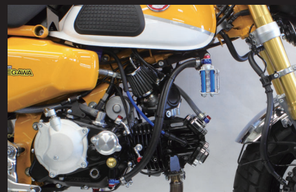
装着写真(ラバーホース/3フィン4オイルライン)