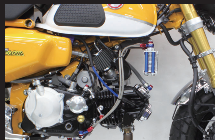
装着写真(スリムラインホース/4フィン5オイルライン)