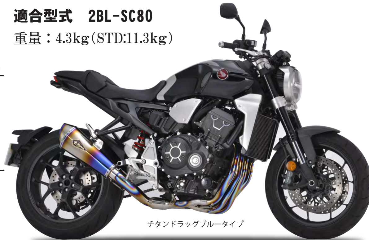
チタンドラッグブルータイプ