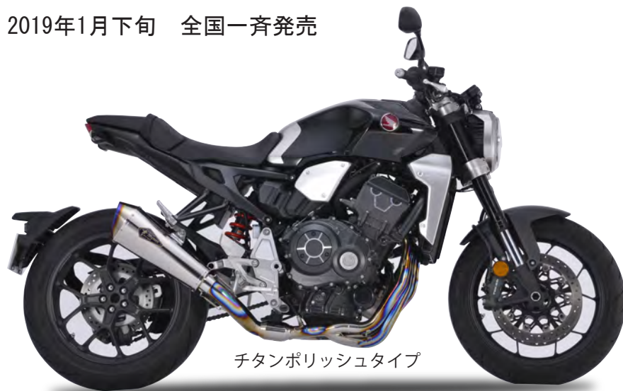
チタンポリッシュタイプ