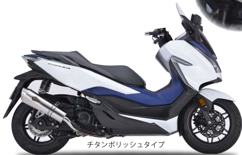
チタンポリッシュタイプ