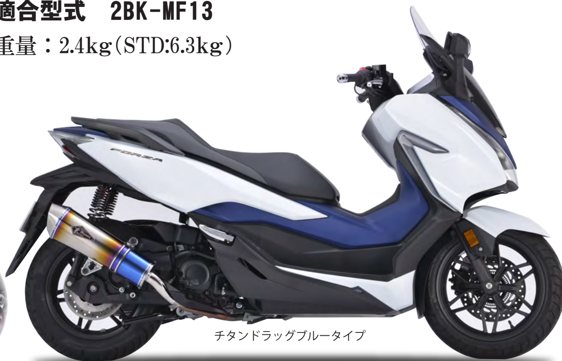
チタンドラグブルータイプ