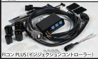
FIコンPLUS(インジェクションコントローラー)

■モンキー(FI)コンプリートエンジン専用FIコンPLUS付属 PC接続などは不要です。 モンキー(FI)用コンプリートエンジンに合わせて、専用インジェクションコントローラー「FIコンPLUS」を自社内で開発しました。 高性能シリンダーヘッドと大排気量のエンジンスペックを最大限に引出す事が出来ます。FIコンPLUSは内部に3次元燃料マップを持っており、各種センサーからの信号を元に高速演算を行い、エンジン状況に合わせて最適な燃料噴射を行う事が出来ます。又、燃料噴射回路だけでなく点火系回路も内蔵し、点火タイミングもコンプリートエンジンに合わせて最適化されています。これにより、ノーマルECUのレブリミットを超える高回転まで使用することが可能になります。 基本マップはカムシャフト、マフラーの違いで設定されています。基本マップからの燃料補正やリミッターの回転数設定はFIコンPLUS本体のロータリースイッチをドライバーで回すだけで簡単に設定する事が出来ます。