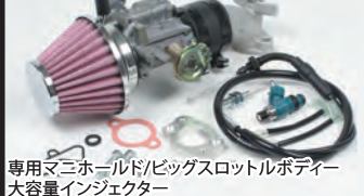
専用マニホルド/ビッグスロットルボディ-大容量インジェクター

■強化クラッチ 強化クラッチは5ディスクを採用し、ハイパワーエンジンに起こるクラッチの滑りを解消します。 スペシャルクラッチ(湿式)(プライマリー式)のクラッチカバーはマグネシウムダイカスト製を採用。表面にはブラウン塗装が施されています。 クラッチカバーはサーモスタットの取付けを可能とした 特許取得クラッチカバー です。別売のサーモスタットユニットを装着することで、オーバークールを防止することが出来ます。 更にオイル取出し口が装備され、オイルクーラーへのオイル取出しが行えます。クラッチケーブル850mm付属。 コンプリートエンジン採用の スペシャルクラッチ(湿式/プライマリー式) は、 スリッパクラッチ機構有り仕様になります。 スリッパクラッチは高回転時のシフトダウンによる急激なエンジンブレーキのショックを緩和します。