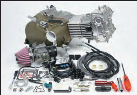
デスモドロミック4V コンプリートエンジン124cc プライマリー式キックスターターシステムクランクケース スペシャルクラッチ 5ディスク(湿式)/ワイヤー式

コンプリートエンジンを購入する場合、注文書と契約書の記入を行い、FAX等により、送付して頂く必要があります。下記シリンダーヘッド、排気量、スペシャルクラッチの仕様/作動方法を選択して頂き、対象となるエンジン品番をご確認下さい。別紙の注文書に必要事項等を記入し、対象エンジン品番の横にある注文数記載枠の部分に数量を記入して下さい。次に別紙のコンプリートエンジン専用契約書をご記入頂き、注文書と共に弊社にFAX等で送付して下さい。 ※仕様変更について:下記エンジン仕様以外のエンジンの仕様変更は出来ません。予めご了承下さい。