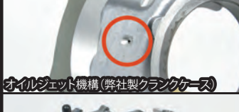
オイルジェット機構(弊社製クランクケース)

■クランクシャフトサポートプレート(3点支持ベアリング内蔵) クランクシャフトの耐久性を高める補強パーツです。クランクケースに取付けるサポートプレート内にボールベアリングを設けることで、クランクシャフトジャーナル部を2点支持から3点支持に変更し、エンジンの高回転域に起因するクランクシャフトの振れを制限することが出来ます。 特に大排気量エンジンの高回転域にて高い効果を発揮します。