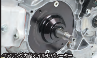
ベアリング内蔵オイルシール

■強制開閉式カムシャフト 強制バルブ開閉機構のカムシャフトには「開」と「閉」それぞれ独立した作用を行うカム山を備えています。 カムシャフトジャーナル部は両端ボールベアリング支持を採用し、始動時や低速からのカムシャフトへの摩擦抵抗を低減します。 カット付属カムシャフトは各排気量に適した推奨カムシャフトが設定されています。