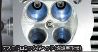
デスモドミック4Vヘッド(燃焼室形状)

コンプリートエンジンは弊社メカニックが各パーツを適切な管理の上で組付け作業を行ったハイクオリティーエンジンです。