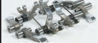
ロッカーアーム(強制開閉機構)

■デスモドミック4V デスモドミック機構は、特殊形状カムシャフトとロッカーアームによりバルブを強制的に開閉する機構で、バルブスプリングが無いことから高回転域でのサージングが起らず、カムシャフト駆動に関わるフリクションが非常に少ないのが特徴です。 デスモドミック機構の特性に弊社のシリンダーヘッド開発技術が加わり、最高峰クラスの吸排気効率と高いエンジン性能を実現しました。 バルブ径 インテーク:22mm×2/エキゾースト:19mm×2 ロッカーアーム(強制バルブ開閉機構):バルブスプリングを持たず、カムシャフトによりバルブ開閉を強制的に行います。 バルブスプリング式に対し動弁系の抵抗を減らすと共に高回転域で起こるバルブサージングを無くし、スムーズなエンジンレスポンスと高出力を得ることが出来ます。排気ポートはモンキー(キャブレター車)と同位置に設定。これによりご使用頂けるマフラーはモンキー(FI)の専用品では無く、弊社モンキー(キャブレター車)用マフラーのラインナップからお選び頂けます。 最適なバルブ挟み角と燃焼室のコンパクト化に伴い、M8スパークプラグを採用。アルミ削り出しシリンダーヘッドカバー採用。