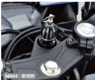
98604 : 使用例