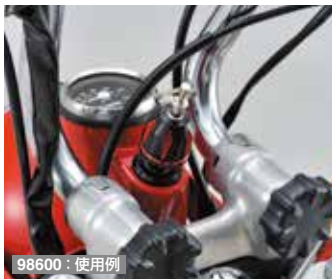
98600 : 使用例