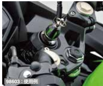
98603 : 使用例