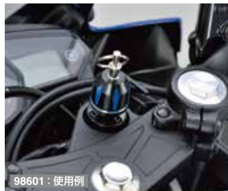
98601 : 使用例