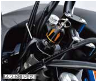
98602 : 使用例