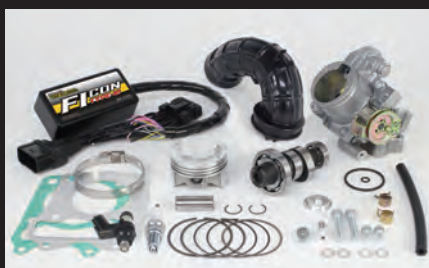
ハイパーチューニングセット (ビッグスロットルボディ付属)