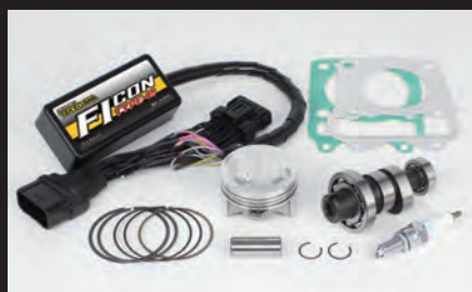
ハイパーチューニングセット (ビッグスロットルボディ無し)

■ビッグスロットルボディ付属ハイパーチューニングセットには、フューエルインジェクターASSY.(00-00-0487)が付属しています。