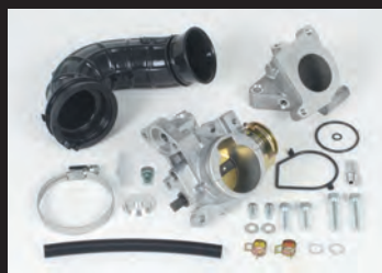
ビッグスロットルボディーキット