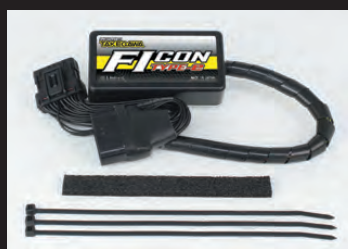
FIコンTYPE-e(インジェクションコントローラー)