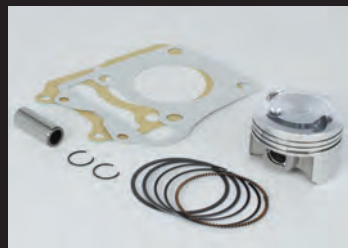
ハイコンプピストンキット