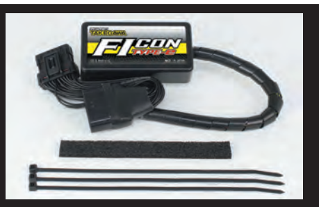
FIコン TYPE-e 内蔵燃料調整マップ一覧