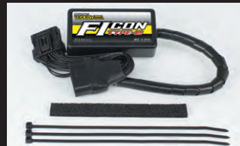
FICON TYPE-e(インジェクションコントローラー)