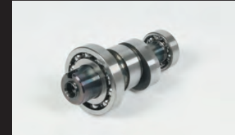
スポーツカムシャフト(N-10カム)

■ハイパーeステージボアアップキットはeステージボアアップキットにFIコンTYPE-e(インジェクションコントローラー)、スパークプラグが付属しています。 キットにはノーマルスロットルボディークットとビッグスロットルボディークットの2種類があります。ビッグスロットルボディークットは更にビッグスロットルボディークットが付属