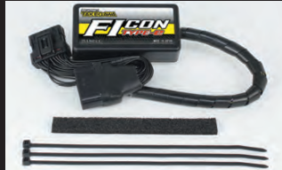
FIコンTYPE-e(インジェクションコントローラー)