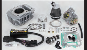
Hyper e-Stageボアアップキット143cc