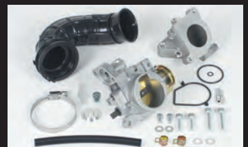
ビッグスロットルボディーキット