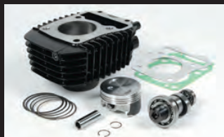
e-Stageボアアップキット143cc