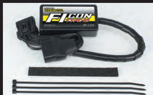
FIコンTYPE-e(インジェクションコントローラー)