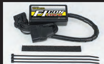
FICON TYPE-e(インジェクションコントローラー)