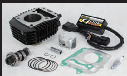
Hyper e-Stageボアアップキット143cc (ノーマルスロットルボディ仕様)

キット構成は、ノーマルシリンダーヘッド用ビッグスロットルボディキットにビッグスロットルボディ用コネクティングチューブ(ノーマルエアクリーナーボックス接続)が付属。ノーマルシリンダーヘッドの性能を最大限に引出し、高出力化を実現します。高回転域までストレス無く回るエンジン特性をお楽しみ頂けます。ビッグスロットルボディ ボア径:Φ34 エアフィルターキット(ビッグスロットルボディ用):表面積の増大により、高い吸入効率を得ることが出来ます。 ■ビッグスロットルボディキットには、フューエルインジェクターASSY.(00-00-0487)が付属しています。