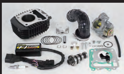
Hyper e-Stageボアアップキット143cc (ビッグスロットルボディ仕様)