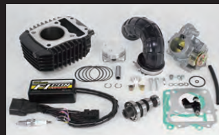
Hyper e-Stageボアアップキット143cc