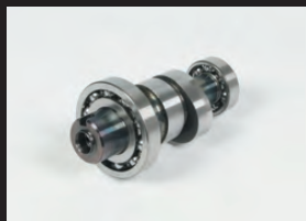
スポーツカムシャフト(N-15カム)