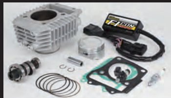
Hyper S-Stageボアアップキット181cc (ノーマルスロットルボディ仕様)

■ハイパーSステージボアアップキット181ccには、スロットルボディの仕様にかかわらず、フューエルインジェクターASSY.(00-00-0487)が付属しています。