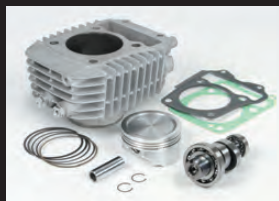
S-Stageボアアップキット181cc

■SステージボアアップキットとFIコンTYPE-eを装着する場合、弊社製指定フューエルインジェクターASSY.(00-00-0487)の同時装着が必要。※ハイパーSステージキット付属品