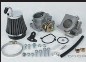
ビッグスロットルボディークット