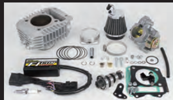
Hyper S-Stageボアアップキット181cc (ビッグスロットルボディ仕様)