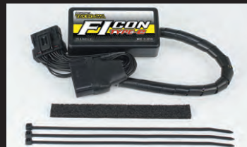
Ficon TYPE-e(インジェクションコントローラー)