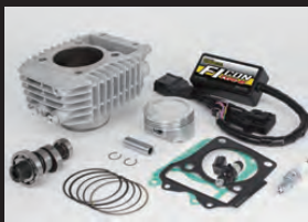
Hyper S-Stageボアアップキット181cc