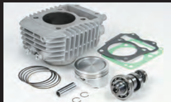
S-Stageボアアップキット181cc

■SステージボアアップキットとFicon TYPE-eを装着する場合、弊社製指定フェーエルインジェクターASSY.(00-00-0487)の同時装着が必要。※ハイパーSステージキット付属品