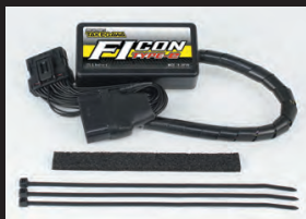
FIコンTYPE-e(インジェクションコントローラー)