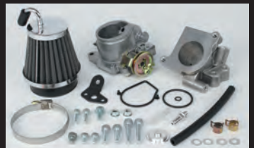
ビッグスロットルボディークット