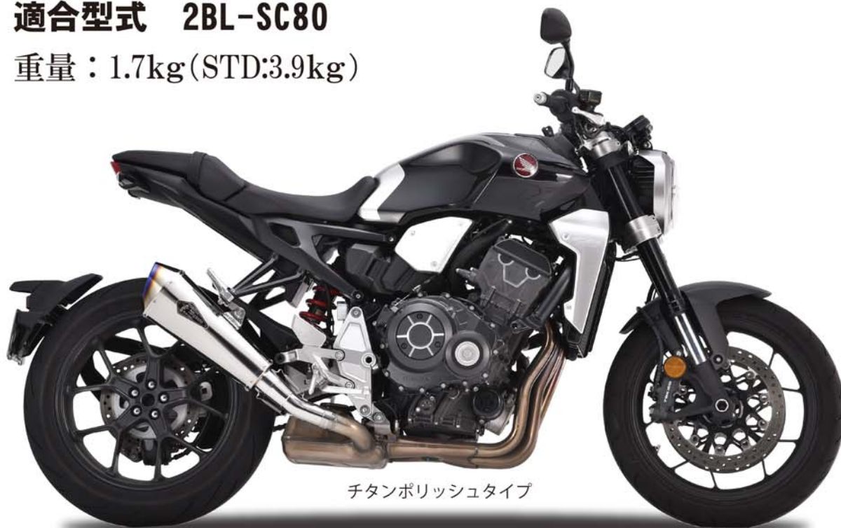
チタンポリッシュタイプ