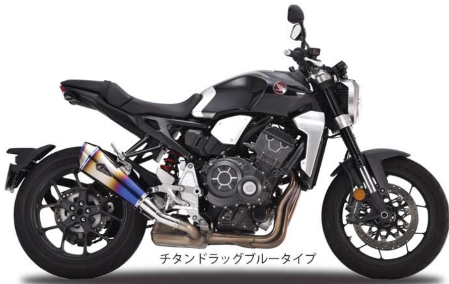
チタンドラッグブルータイプ