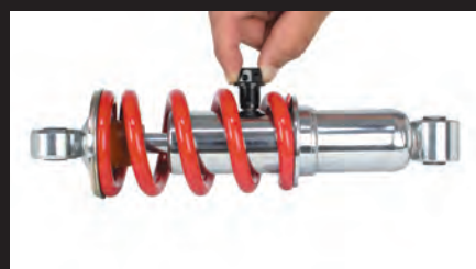
約1.6kgのリアショックも持ち上げる強力な磁力