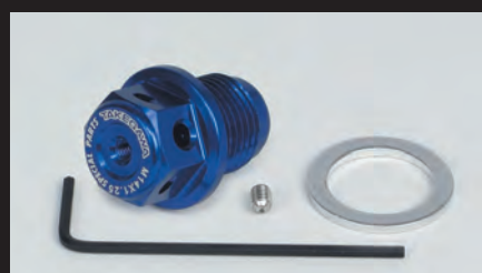
マグネット付きドレンボルト(M14×P1.25) (ブルー)

エンジンオイルに混ざった鉄粉をドレンボルトに設けたマグネットが強力な磁力で吸着します。これにより、オイル内にある鉄粉が減少し、エンジンオイル本来の安定した潤滑性能を発揮することが可能となります。更に弊社製アルミドレンボルトには、脱落防止としてワイヤーロックが行えるワイヤーロック穴と弊社製スティック温度センサー差込穴を備えております。スティック温度センサーの取付けが可能なので、弊社製コンパクトLEDサーモメーター(スティック温度センサー付き)、又はサーモメーター付き各種メーターを別途ご購入頂くことでドレンボルト部での温度を計測することが出来ます。ドレンボルト本体はアルミ材を精巧に削り出し、表面にカラーアルマイトを施しています。カラーはシルバーブラック、ブルー、レッドの4種類。ノーマルドレンボルトから美しく仕上げられた弊社製アルミドレンボルトへ変更することで、エンジン周りにワンポイントとしてドレスアップすることが出来ます。弊社ロゴレーザーマーキング入り マグネットには磁力が強力なネオジムマグネットを採用。 ■M14×P1.25の純正ドレンボルトと交換してご使用頂けます。 ※下記参考車両はネジサイズの合う車両を一部抜粋しております。実際の取り付けに関しましては未確認(温度センサー取付部のクリアランス等)の為、詳細図での寸法確認や現車による確認作業が必要になります。又、車両名が同じであっても、年式によりネジサイズが異なる場合がありますので、現車確認が必要です。