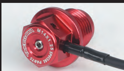
スティック温度センサー差込穴/ワイヤーロック穴