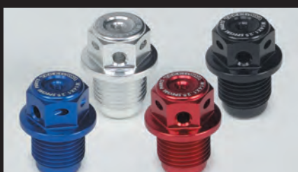
カラーラインナップ