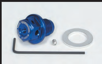
マグネット付きドレンボルト(M12×P1.5)(ブルー)

エンジンオイルに混ざった鉄粉をドレンボルトに設けたマグネットが強力な磁力で吸着します。これにより、オイル内にある鉄粉が減少し、エンジンオイル本来の安定した潤滑性能を発揮することが可能となります。更に弊社製アルミドレンボルトには、脱落防止としてワイヤーロックが行えるワイヤーロック穴と弊社製スティック温度センサー差込穴を備えております。スティック温度センサーの取付けが可能なことで、弊社製コンパクトLEDサーモメーター(スティック温度センサー付き)、又はサーモメーター付き各種メーターを別途ご購入頂くことでドレンボルト部での温度を計測することが出来ます。ドレンボルト本体はアルミ材を精巧に削り出し、表面にカラーアルマイトを施しています。カラーはシルバーブラック、ブルー、レッドの4種類。ノーマルドレンボルトから美しく仕上げられた弊社製アルミドレンボルトへ変更することで、エンジン周りにワンポイントとしてドレスアップすることが出来ます。弊社ロゴレーザーマーキング入り マグネットには磁力が強力なネオジムマグネットを採用。 ■M12×P1.5の純正ドレンボルトと交換してご使用頂けます。参考装着可能車両は下記をご覧ください。