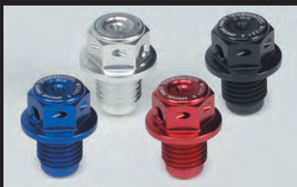
カラーラインナップ