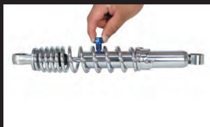
約1.2kgのリアショックも持ち上げる強力な磁力