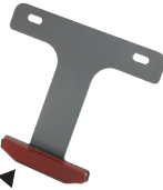
リフレクター KIT 801-0800300 ¥2,300+税