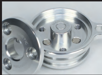
オイルフィルターカバー内にマグネットを内蔵