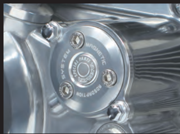
レーザーマーキングロゴ入り