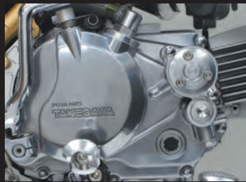
モンキー スペシャルクラッチカバー(ダイカスト製)装着