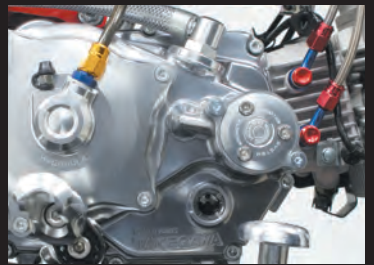
モンキー スペシャルクラッチカバー TYPE-R(WET/油圧式)装着