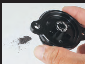
マグネットを外すと簡単にお手入れ出来ます。