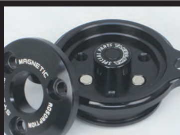
オイルフィルターカバー内にマグネットを内蔵