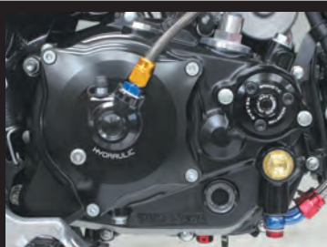
GROM スペシャルクラッチカバー (WET/油圧式) 装着