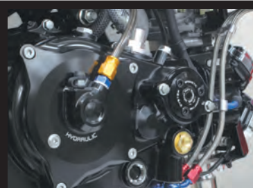
GROM スペシャルクラッチカバー (WET/油圧式) 装着