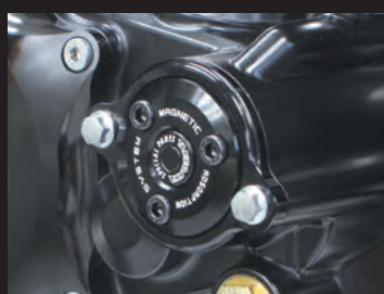
レーザーマーキングロゴ入り