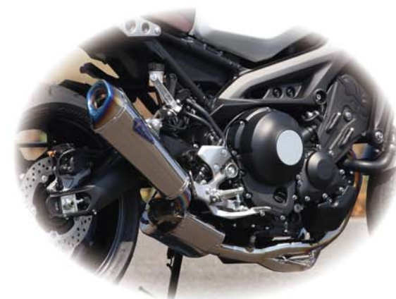
チタンポリッシュチタンエンドタイプ

Fun to Ride R3 Gear http://www.rsgear.co.jp