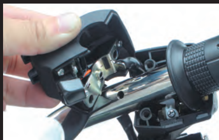
スイッチ用の位置決め穴の加工済み