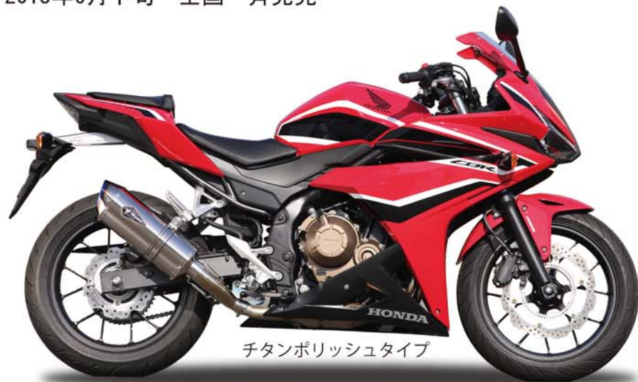
チタンポリッシュタイプ