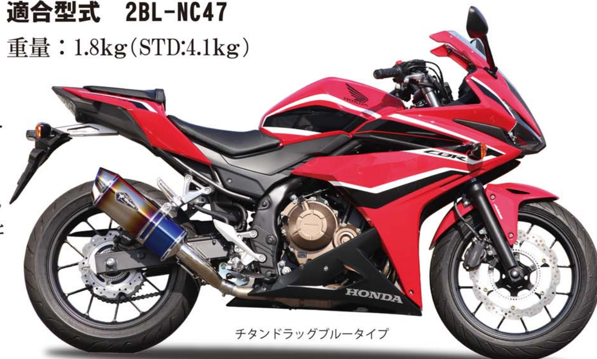
チタンドラッグブルータイプ