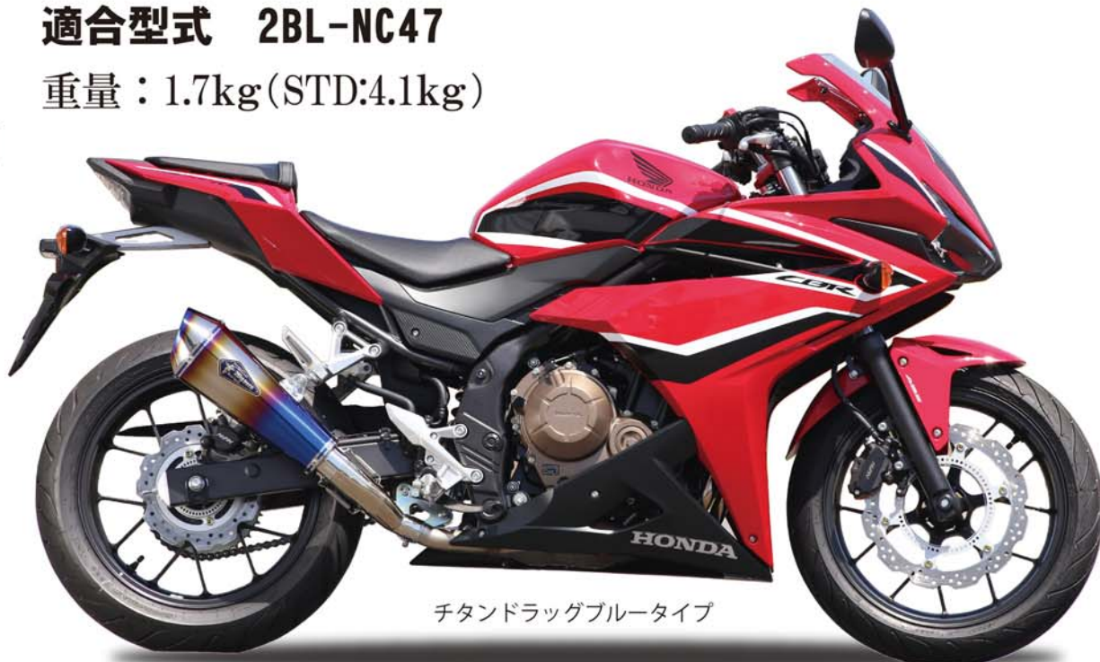
チタンドラッグブルータイプ