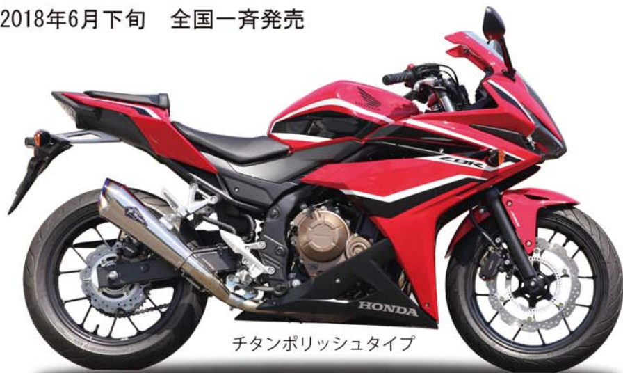
チタンポリッシュタイプ