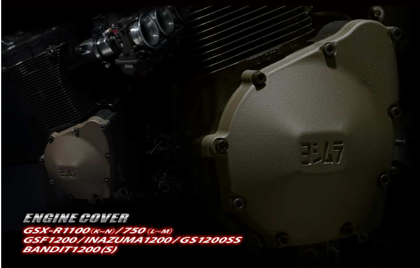
ENGINE COVER GSX-R1100 (K-N) / 750 (L-M) GSF1200 / INAZUMA1200 / GS1200SS BANDIT1200 (S)

GSX-R1100 (89-92) / 750 (90-91)、GSF1200 (95-)、INAZUMA1200 (98-)、 GS1200SS (02-)、BANDIT1200/S (00-) アルミスタータークラッチカバー / アルミパルサーカバー