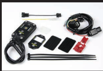
FIコン2(インジェクションコントローラー)