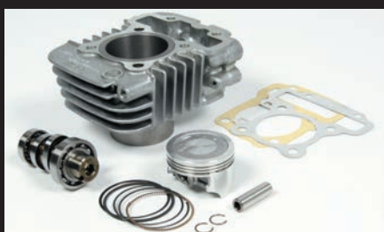
S-Stageボアアップキット81cc