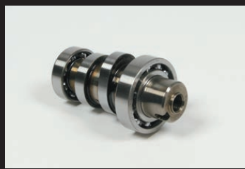
スポーツカムシャフト

ハイパーSステージボアアップキットはSステージボアアップキットにFIコン2(インジェクションコントローラー)、ドライブスプロケット15T、スプロケットガードプレートが付属しています。