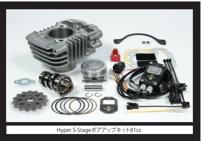
Hyper S-Stageボアアップキット81cc

ハイパーSステージ81ccキットに付属の15Tドライブsprocketを装着する場合、純正ガードプレートに干渉し取付け出来ない為、本製品が必要になります。