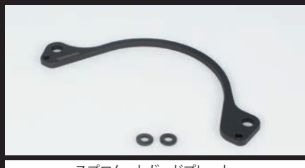
スプロケットガードプレート