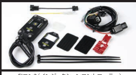
Fコン2(インジェクションコントローラー)