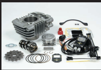
Hyper S-Stageボアアップキット81cc