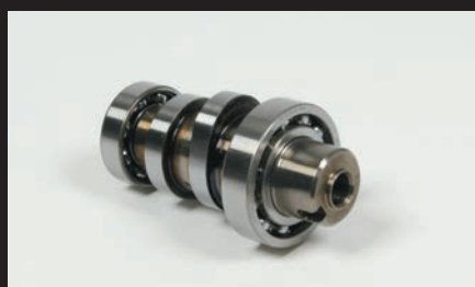
スポーツカムシャフト

クロスカブ50(AA06)にはドライブチェーンによる周辺部品の破損を防ぐ為、ガードプレートがフロントスプロケットカバー部に存在します。弊社製15T/16Tドライブスプロケットを装着する場合、純正ガードプレートに干渉し取付け出来ない為、本製品が必要になります。 ■ノーマルドライブスプロケットの歯数は13Tです。 ■スチール製ドライブスプロケット:弊社製ドライブスプロケットは下記12T、13T、14T、15T、16Tの5種類からお選び頂けます。※17Tに関してはガードが干渉し、取付け出来ません。