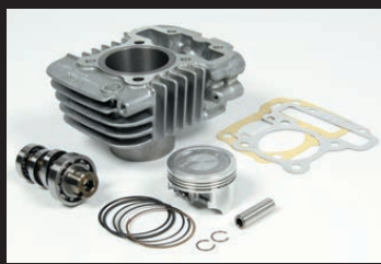
S-Stageボアアップキット81cc