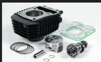
e-Stage N15ボアアップキット143cc (スポーツカムシャフト付属)