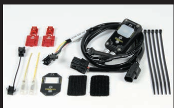
FIコン2(インジェクションコントローラー)