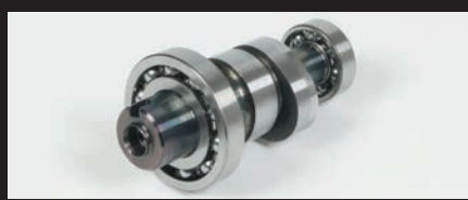
スポーツカムシャフト(N-15)

※ビッグスロットルボディーに対応する為、エアクリナーボックスの穴径を広げる加工が必要です。