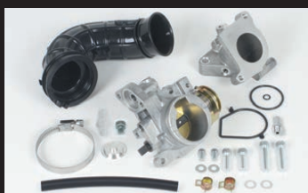
ビッグスロットルボディーキット (ノーマルヘッド用)