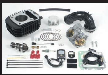
Hyper e-Stage N15 ボアアップキット143cc (ビッグスロットルボディー仕様)