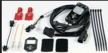
FIコン2(インジェクションコントローラー)