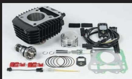
Hyper e-Stage N15ボアアップキット143cc (ノーマルスロットルボディー仕様)

ノーマルシリンダーヘッドの性能を最大限に引出し、高出力化を実現します。高回転域までストレス無く回るエンジン特性をお楽しみ頂けます。ビッグスロットルボディー ボア径:φ34 ノーマルエアクリナーボックスに接続出来るコネクティングチューブ付属。