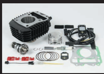
Hyper e-Stage N15 ボアアップキット143cc (ノーマルスロットルボディー仕様)

ノーマルシリンダーヘッドの性能を最大限に引出し、高出力化を実現します。高回転域までストレス無く回るエンジン特性をお楽しみ頂けます。ビッグスロットルボディー ボア径:φ34 ノーマルエアクリナーボックスに接続出来るコネクティングチューブ付属。