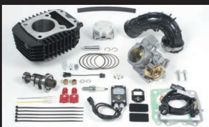
Hyper e-Stage N15ボアアップキット143cc (ビッグスロットルボディー仕様)