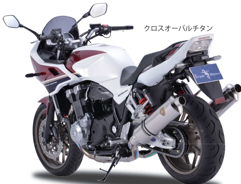
クロスオーバーバルチタン