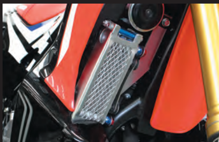
オイルクーラー装着 (CRF250 RALLY)