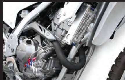
オイルクーラー装着 (CRF250L)