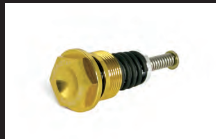
サーモスタットユニット(別売)