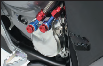
専用アダプター装着 (CRF250 RALLY)